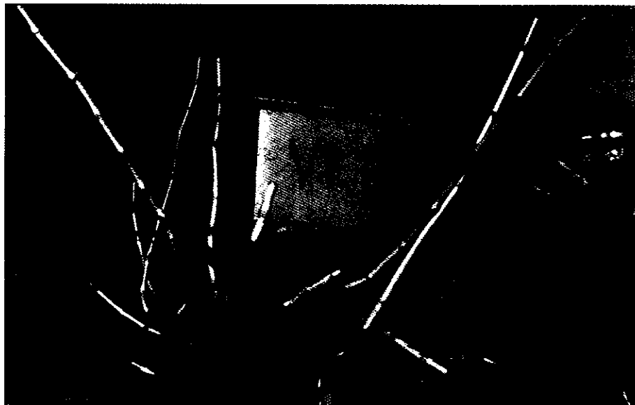
شکل ۲- موقعیت شاخه‌های یکساله شش جوانه‌ای همراه با سیخک‌های جانشین دو جوانه‌ای پس از هرس Fig. 2. Position of six-bud canes with two-bud substitution spurs after pruning